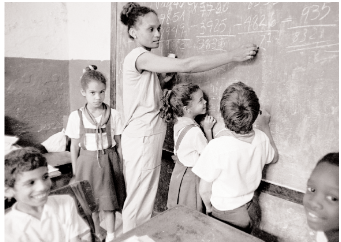
Escuela en Cuba

Marta Scarpato Consultora Especial sobre Igualdad y Derechos Sindicales Internacional de la Educación