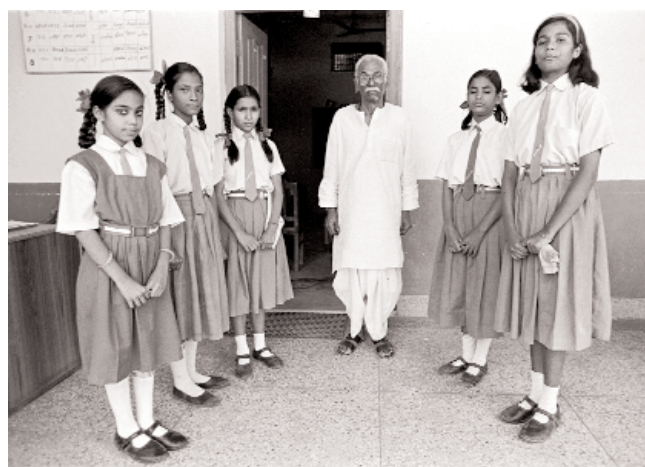
Un maestro y sus alumnas en una escuela de la India

La resistencia a disminuir del número de niñas trabajadoras, es uno de los obstáculos mayores para el cumplimiento de las Metas del Milenio en materia de paridad educativa en el 2015 y de los Compromisos de Dakar asumidos por la comunidad internacional sobre Educación para todos y todas. Otro dato preocupante que se mantiene: de los/as 100 millones de niños que no van a la escuela a nivel mundial, 60 millones son niñas. Otra estadística que no cambia y que justifica lo expresado en numerosas ocasiones y en diversos foros internacionales por los sindicatos de la enseñanza: dado que la mayoría de quienes están fuera de los sistemas educativos son niñas que trabajan, los esfuerzos por asegurarles una educación de calidad deben ir asociados indefectiblemente con los que se hacen para eliminar el